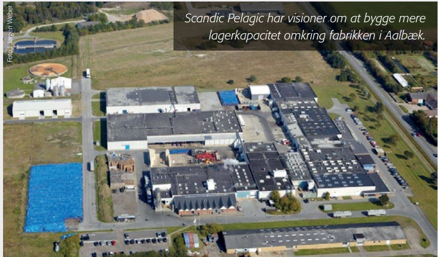
Scandic Pelagic har visioner om at bygge mere lagerkapacitet omkring fabrikkens i Aalbæk.