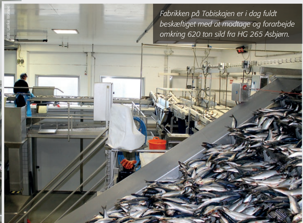
Fabrikken på Tobiskajen er i dag fuldt beskæftiget med at modtage og forarbejde omkring 620 ton sild fra HG 265 Asbjørn.